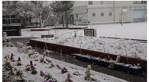
1月6日、雪の降り積もった校庭や花壇