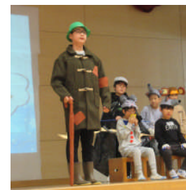
はるかぜ学級は、はっぴい 発表会で頑張りました！