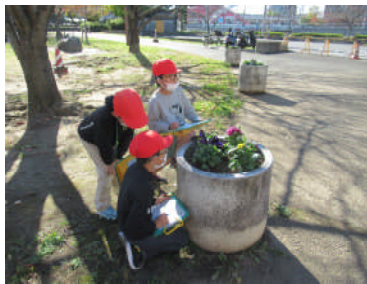
2年生も若潮公園へ。花の 様子をスケッチしました。