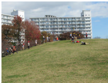
1年生は、若潮公園へ。 広い場所でゴロゴロ・・・。

11月は、新型コロナウイルス感染症が拡大することなく落ち着いていたこともあり、学習の一環として子どもたちも楽しみにしていた校外学習を実施することができました。当日が近づくにつれてそわそわしていた子どもたち。みんなで学校を離れて活動する子どもたちの表情は、生き生きとして楽しそうでした。1年生から6年生まで、全員無事に行って帰ってくることができたことが何より！校外学習後は、どの学年もしっかりと振り返りを行い、学習を深めていました。