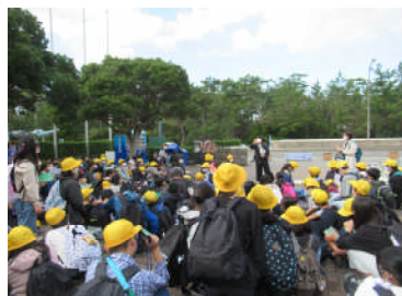
(6年)鴨川シーワールドに到 着。お土産どっさりでした。