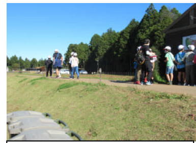
(5年)問題を解きながらウォー クラリーを楽しみました。