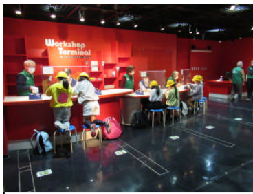
4年生は、千葉市科学館に 行ってきました。