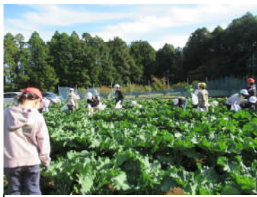
5年生は、大自然の中で収 穫体験をしました。