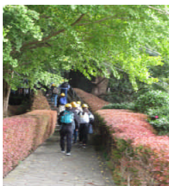
6年生は、鋸山の散策へ。 秋を感じました。