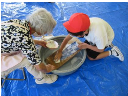
洗濯板を使った家族分の洗濯は大変なことを実感しました。

9月21日(水)に1組、22日(木)に2・3・4組が郷土博物館に行き、昔のくらしを体験してきました。「七輪」「洗濯」「道具」「ベカ舟」の4種類を時間で区切って体験しました。自宅ではほとんど経験することのない活動でしたが、普段とは違う状況を楽しみながら、昔のくらしの様子を感じ取りました。各御家庭でも子どもたちが体験した内容を聞いて話題にしていいただけると幸いです。