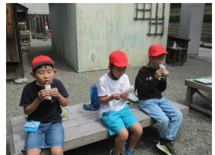
七輪で焼いた魚を味わいました。熱々は美味しいですね。