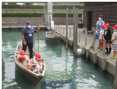
ベカ舟が揺れると子どもたちは大興奮！意外に面白い！？