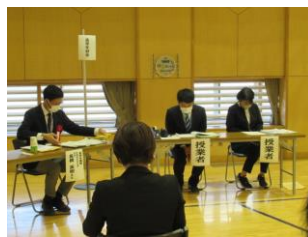
高学年部会 分科会 参考になりました。