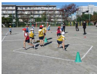
2年生 ボールゲーム 「ダイヤカットサッカー」