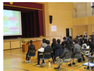
全体会 本校の研究概要説明