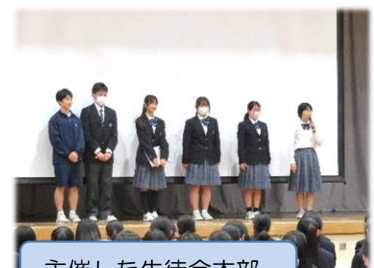
主催した生徒会本部