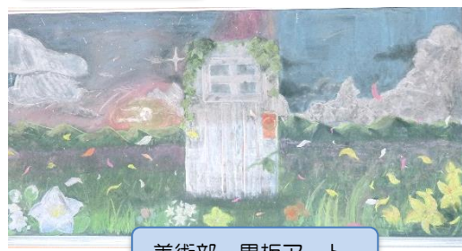
美術部 黒板アート