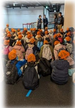
5年千葉市科学館への校外学習マナーを守って行動しました。

学校は、「社会に出るための勉強の場」と考えています。時間を守ること、約束を守ること、意見が違う人とどのように交流していくとよいか、いろいろな立場に立ってみることなど、すべて社会に出たときに必要なことです。学年に応じて、様々な場面で時間を意識して行動できるように声掛けをしているところです。毎日、いろいろなトラブルが起きてても、大人になったときに自分で解決できるよう、発達段階に応じて解決の手助けをしています。