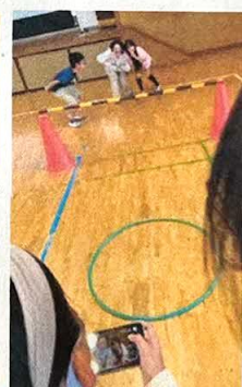
カメラ付きのドローンを操縦する様子