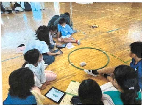
プログラムしたドローンを飛ばしてみる