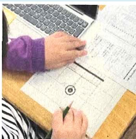
プログラムを考える