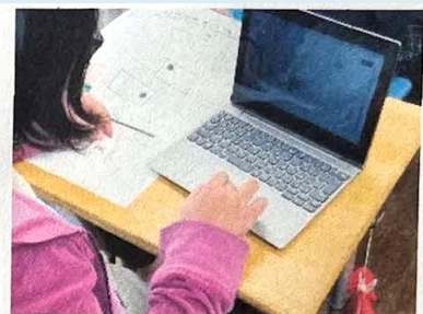
プログラムを検証する