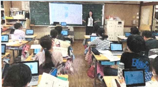
ブロックの意味とドローンの動きを説明する

いよいよ当日。グループに分かれて、実際にドローンを操縦する「マニュアル飛行操縦学習」と、事前に自分たちで作成したプログラムでドローンを飛ばす「ドローンインパクトチャレンジ」を体験しました。