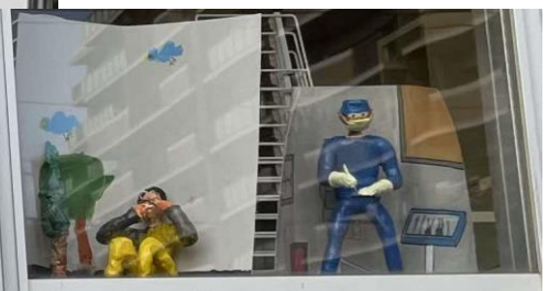
👉図工準備室の窓辺で乾燥待ち。