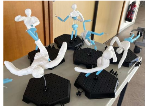
芯材・紙粘土の段階で、すでにリアルな動きが伝わってきます。