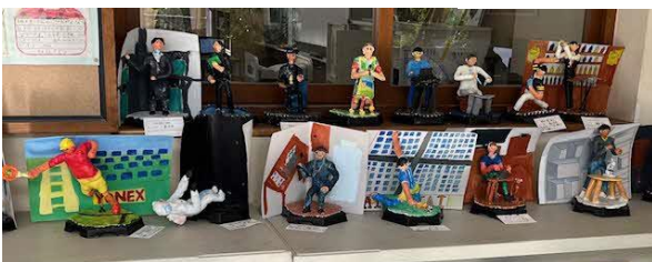
👉背景もリアルに。12/4からの高洲美術館(校内作品展)でも展示します。