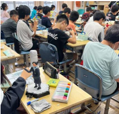
👉制作を通して、作品・自分との対話を深めます。