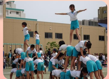
【集団演技2018～THIS IS ME～】