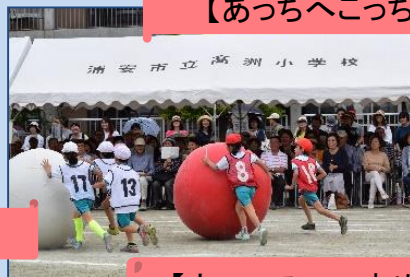
【あっちへこっちへ大玉ころりん】