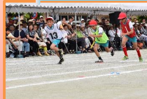
【高学年紅白リレー】

心を一つにした5・6年生の演技。高さのある大技・表現力豊かなウェーブなど見どころ満載でした。