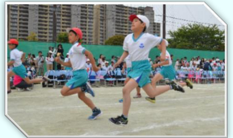
【低学年紅白リレー】