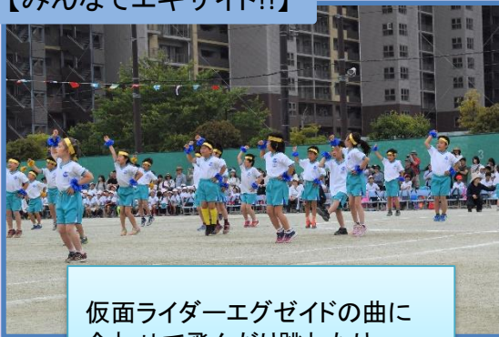
【みんなでエキサイト!!】

仮面ライダーエグゼイドの曲に合わせて飛んだり跳ねたり、初めての演技を頑張りました!