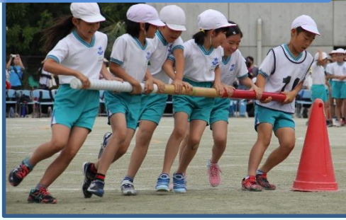
【巻き起こせ!!高洲台風ーン】