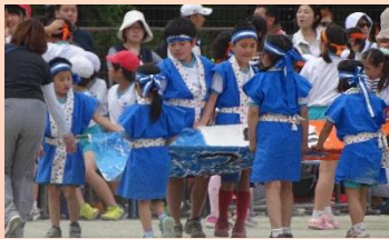
【おおぞらよさこい！】