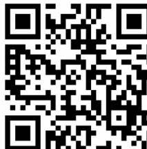
北部小学校申し込みフォーム