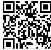
浦安中学校申し込みフォーム