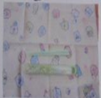
らんちゃんまっと