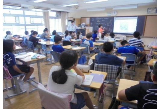
5年生の対話的学習