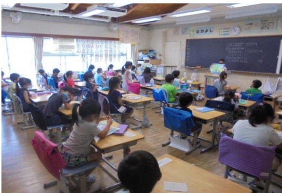
1年生 夏休みの作品発表