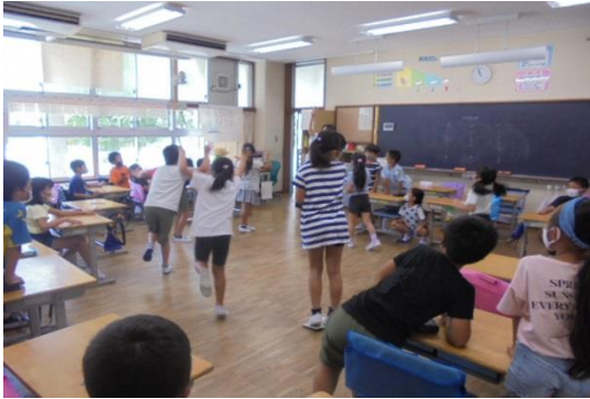
2年生の楽しい活動