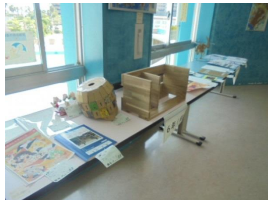
夏休みの作品や自由研究 ①