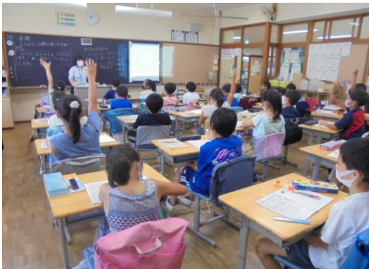
4年生の集中した学習