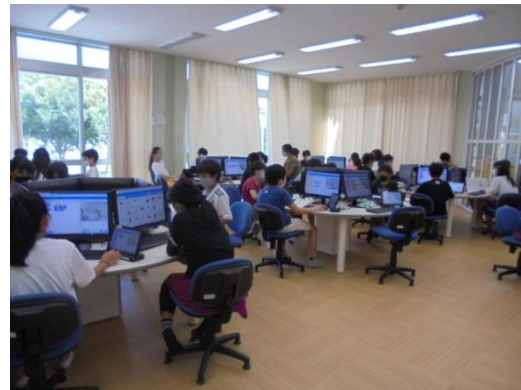
6年生のプログラミング学習