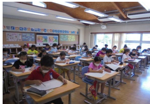
3年生は、エアコンの効く場所に移動して