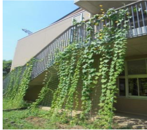
グリーンカーテンも育ちました