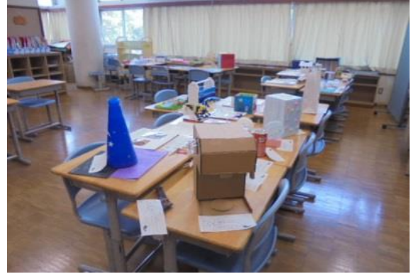
夏休みの作品や自由研究②・③