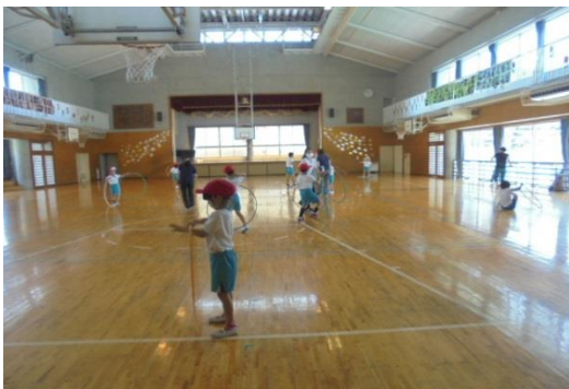
おおぞら学級の楽しい体育

校内に子ども達の元気な姿が見られると、幸せな気持ちになります。初日から子どもたちは、集中してよくやっていて感心します。コロナだけでなく熱中症対策等を講じながらも楽しく充実した2学期がおくれるように教職員一同、力を尽くしてまいります。保護者の皆様も健康に十分気をつけてお過ごしください。2学期もよろしくお願いいたします。