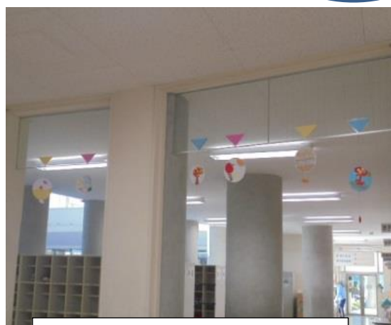
5年生：秋の切り紙つるし飾り