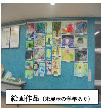
絵画作品（未展示の学年あり）