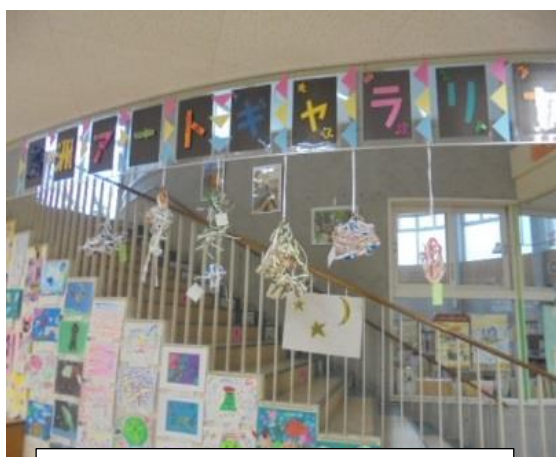
2年生：牛乳パックを使った飾り