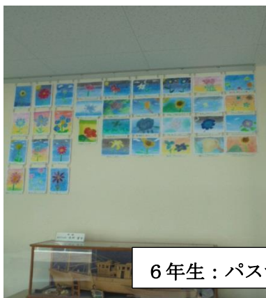
6年生：パステルアート