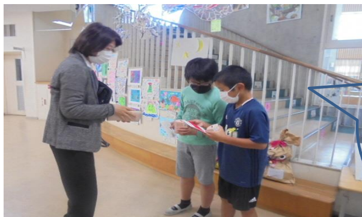
計画委員会による 赤い羽根募金が 始まりました 協力ありがとうございます