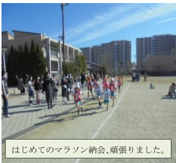
はじめてのマラソン納会、頑張りました。