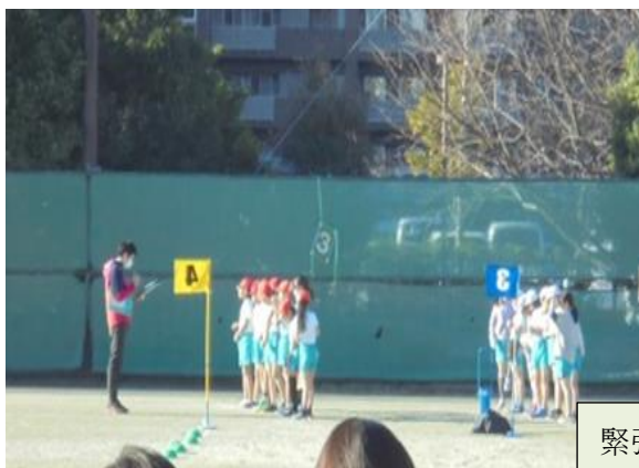
緊張のスタート！最後まで全力で！