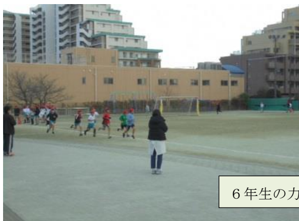
6年生の力強い走り。

今回は、最近の活動の様子をお伝えします。寒い中ですが、「マラソン納会」もおこなわれています。まずは、その一部も紹介します。応援して下さった保護者の皆様、ありがとうございます。