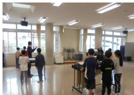
<音楽の学習でのサポート>