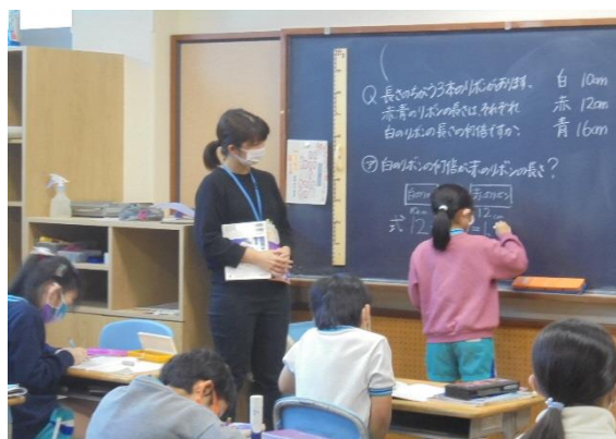
<4年生の算数少人数学習>