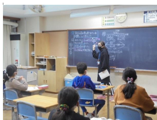
<5・6年生の算数少人数学習>