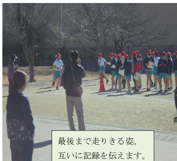
最後まで走りきる姿。 互いに記録を伝えます。