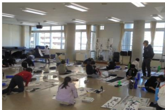
<書写の学習> (書初め練習)