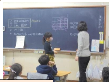
2年生の学習 (一人一人の考えを大切に進めます)