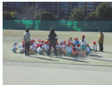
1年生の学習 (一緒に体育もします)