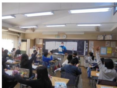
5年生の学習 (一部教科担当制もおこなっています)