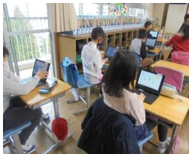
* 自分の考えを積極的に発表する姿 * 3年生の交換授業の様子とタブレット活用学習(e ライブラリ)