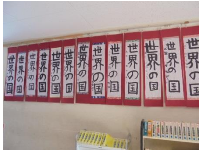
紙上 書初め作品展 NO. 1