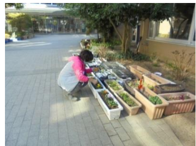
* 学校内外の環境も、たくさんの人たちの力で成り立っています。いつも玄関前の植物を世話して下さる方、栽培委員会のみなさん、興味を持って植物の世話をしているお友だち…。春に向けて植物も芽を出す準備をしているようです。