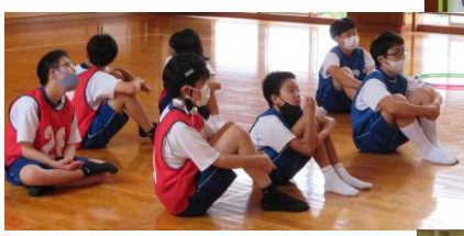
I組 交流スポーツ大会