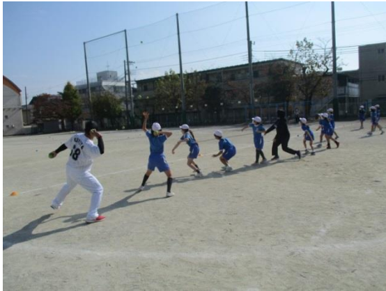
四年生は千葉ロッテマリーンズ選手をお招きして、野球の楽しさを教えていただきました。

スポーツの秋を楽しみました。～4年生マリーンズベースボールチャレンジ 5年生タグラグビー体験～ コロナ禍でもできることを見つけ、大いに楽しみ、スポーツの秋を満喫しました。