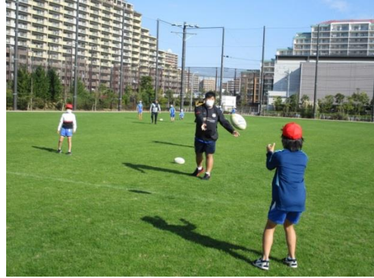
五年生はNTTコミュニケーションズシャイニングアークスの選手とタグラグビー体験をしました。