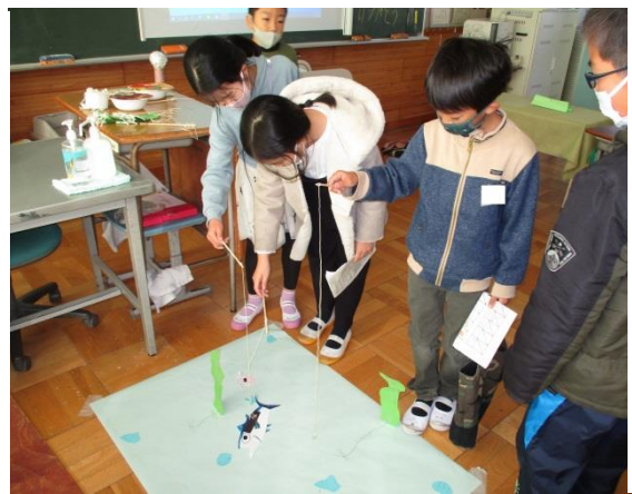
四年生は千葉県がテーマ。漁業が盛んな地域の魚釣りコーナーが楽しそうでした。

◆子どもたちの学校での様子を浦安小学校のホームページでも紹介しています。ぜひご覧ください。