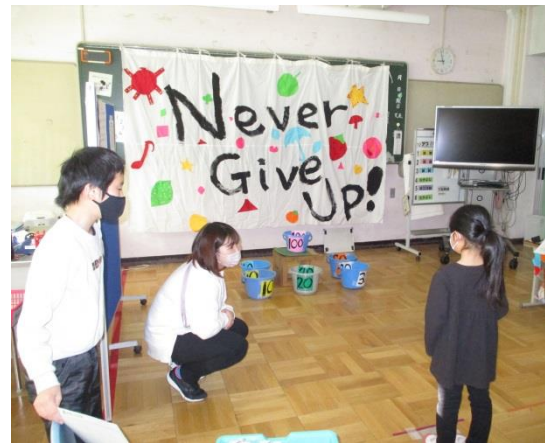
なかよし学級の楽しいゲーム。行列ができるほど大盛況でした。

12月18日(土)にふれあいまつりを行いました。どの学年もこれまでの学習を生かし、しなやかな発想で発表することができました。たくさんのお客さんが見に来てくれて、どの子も張り切って発表している姿がほほえましかったです。おうちの方にも来ていただき、嬉しそうでした。よりよい発表にするために友だちと知恵を出し合い、協力し合った貴重な経験になりました。終わった後は、PTAのサンタさんから参加賞をいただき、笑顔いっぱいでした。