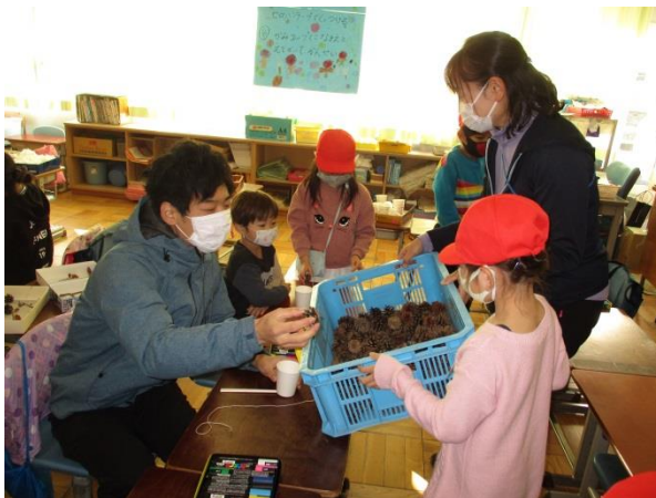
一年生は木の実を使って制作。おうちの方にも参加していただき嬉しそうでした。