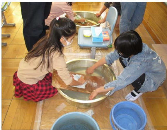
三年生は昔の道具。実物を使った体験コーナーが人気でした。