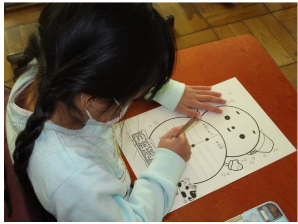
3学期の目標を書きました。丁寧な文字にやる気が伝わってきました。