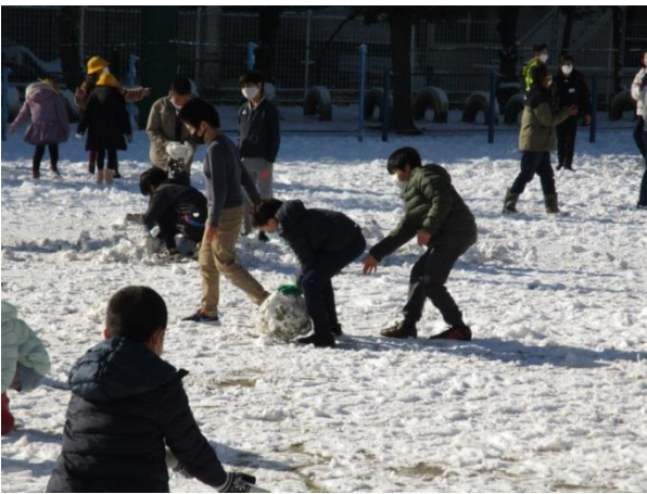
校庭で雪遊びの時間をとりました。どの子もおおはしゃぎでした。

1年生はさっそく「3学期の目標」を書いて、発表しあっていました。「文字をきれいに書きます。」「算数で100点満点をとります。」「廊下を走らないようにします。」・・・どの子の目標にも気持ちも新たに頑張ろうとする意欲が感じられました。