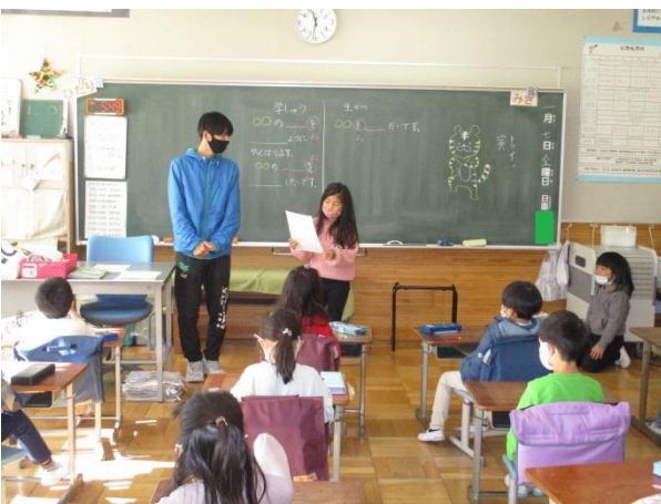
一人ずつ、自分の目標を発表しました。有言実行です。