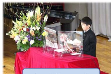
新入生誓いの言葉