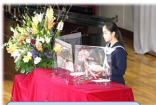
在校生歓迎の言葉