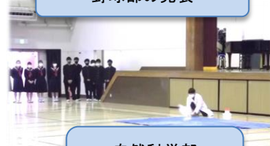
自然科学部 粉じん爆発実験