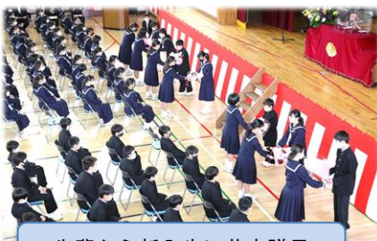
先輩から新入生に花束贈呈

4月9日に入学式を挙行了しました。新入生は220名。昨年はできなかった新入生そろっての入学式で、先輩からの花束を受け取り、3学年そろっての中学校生活が始まります。