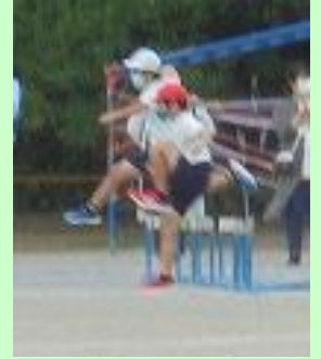
4年「ラッキーサンシャインを探せ！」 ハードルをとび、カードを選んで、ボールか縄とびかフラフープをとぶか？ラッキーサンシャインがでたら、そのまま一直線でゴールへどのカードがでるのかわくわくどきどきのお楽しみ！がんばったね4年生