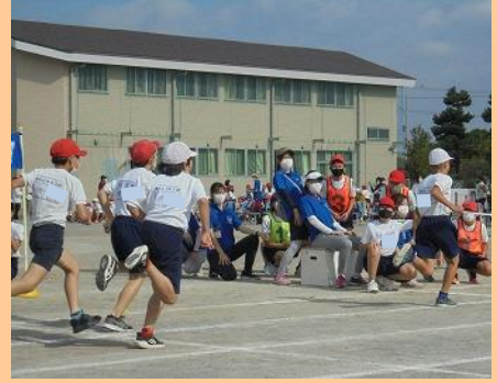
5年「昼に駆ける」 ゴールまで、いっきに駆けぬけた音が聞こえました。