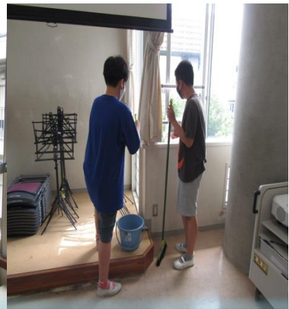
↑ 6年生家庭科の「クリーン大作戦」。「普段気付かない場所をすみずみまで掃除することで、学校だけでなく心もきれいになりました。」という感想があり、学習の成果が感じられます。