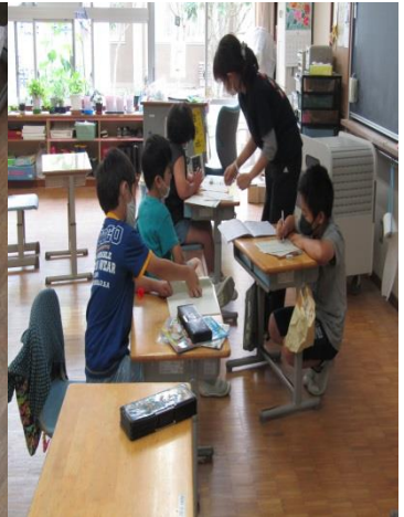
各学年・学級の様子です