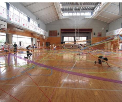
↑ 各学年の学習の様子：図工、水泳学習、社会