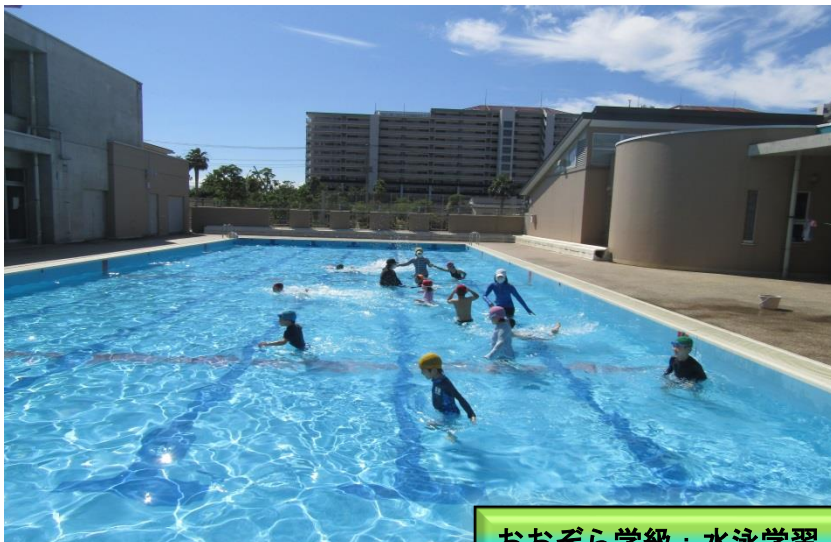
おおぞら学級：水泳学習

2年生のオンライン学習2回目。学習に向けて家庭での準備にご協力いただき、ありがとうございました。教室で学習している友だち、お家で学習している友だち、そして先生。みんながつながっている様子が、とてもほほえましかったです。顔を出すと、みんなが手を振ってくれて、思わず笑顔になりました。