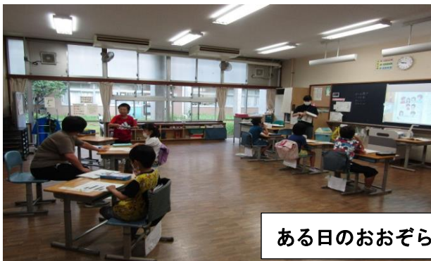
ある日のおおぞら学級