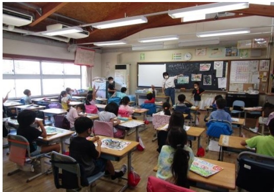
1年生の学習 体育・図工