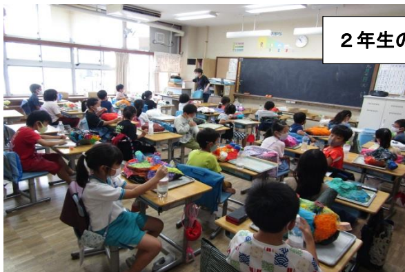
2年生の学習 図工・道徳