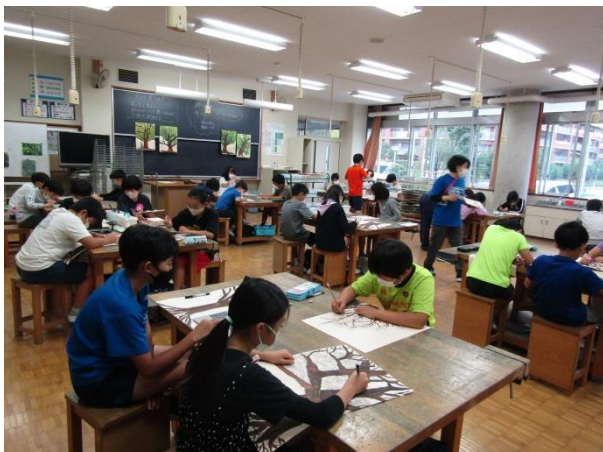
4年生の図工<木々を見つめて>