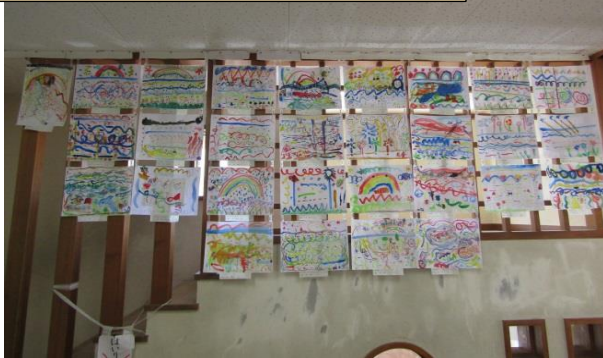
1年生の作品<はじめての絵の具>

11月26日に予定している「千葉県造形部会研究大会浦安大会」に向けての準備も進んでいるところです。天候不順が続いていますが、子どもたちは元気に学習や活動に取り組んでいます。今週は学習参観も予定されています。どうぞよろしくをお願いします。