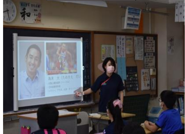
6の1「生き抜くチカラ」