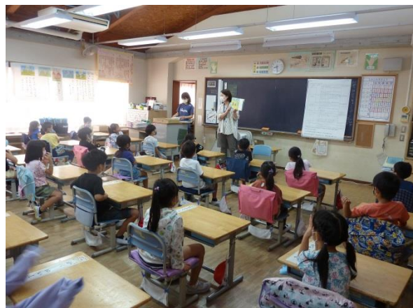
1の2「くまの子ウーフ」