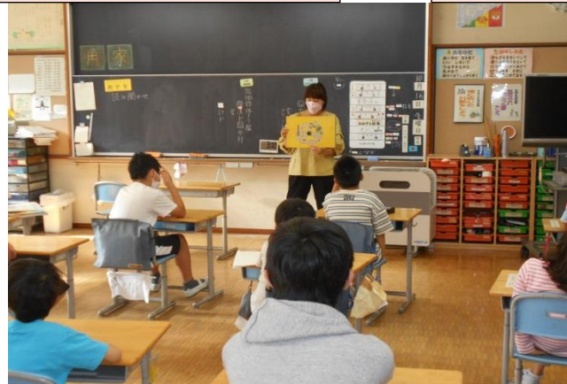
おおぞら「できたよできたよ」「なんで、なんで」