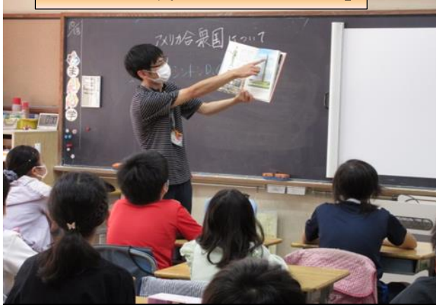
5の3「This is ワシントン！」