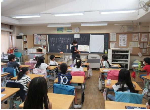
3の1「ぼくはあるいた まっすぐまっすぐ」「ねえ、どれがいい？」