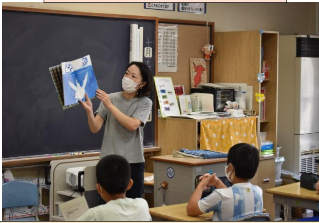
6の2「へいわってすてきだね」「ダジャレレストラン」