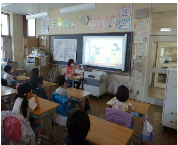
2の2「きみはほんとうにステキだね」