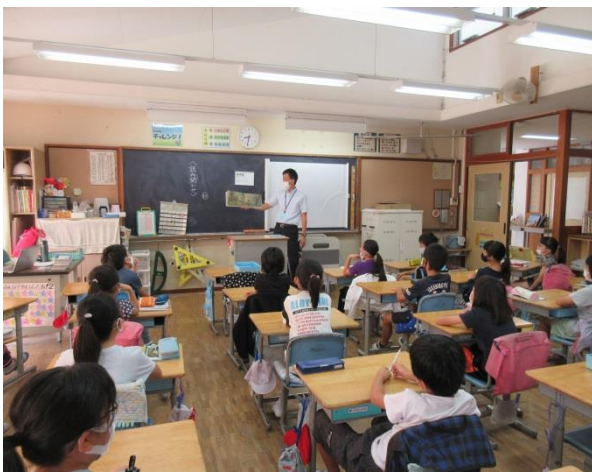
3の3「だいくとおにろく」「浦安の昔ばなし」