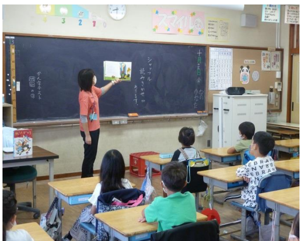
2の1「よろしくともだち」