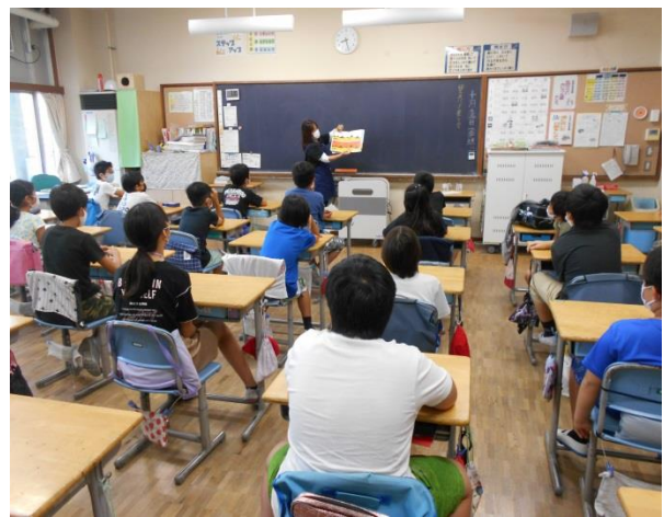
4の1「おまえ うまそうだな」