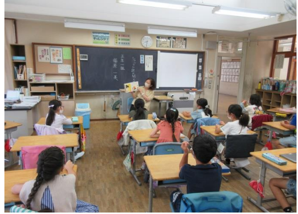
3の2「おこだでませんように」