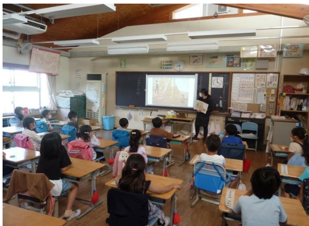
1の1「もりのかくれんぼう」