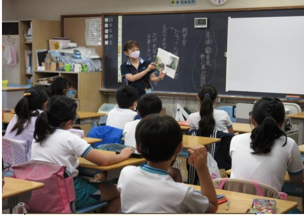
5の1「しあわせの3つのおしえ」