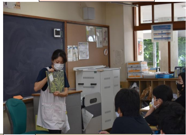
6の3「たいせつなこと」