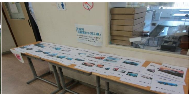
<各学年の準備風景> 作品やこれまでの学習の足跡を掲示したり発表の練習をしたり・・・。念入りに準備をしました。