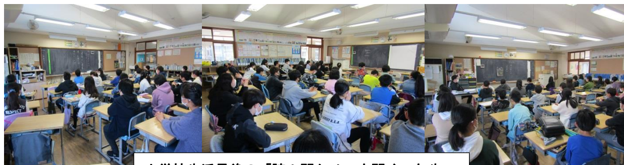
小学校生活最後の「読み聞かせ」を聞く6年生