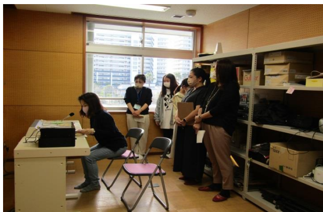
放送室から「読み聞かせ」と「メッセージ」