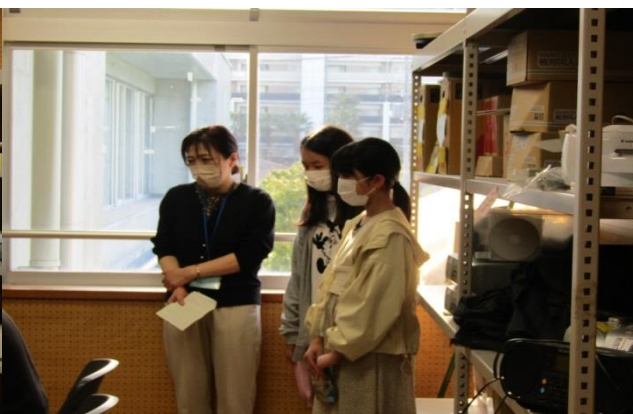
お礼の言葉を述べた6年生の代表