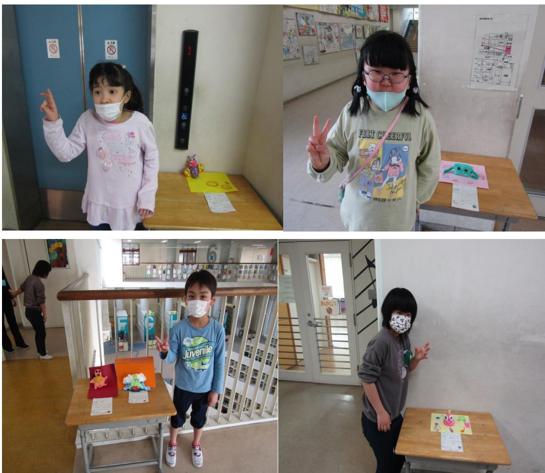
卒業生の作品（左側）

おおぞら学級のみんなの作品が、校内に飾られました。学校に潜む生き物たち（仲間たち）みんなとってもかわいいです。