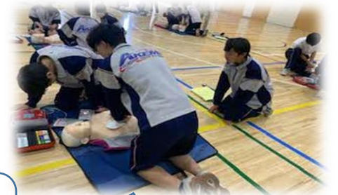
救命救急 練習 (2学年) 人形を使って、AEDの使い方や人口マッサージの仕方を含めた心肺蘇生法を学びました。何が起こるかわかりません。助け合う心を持って、しっかりと技術を身につけられるよう、真剣に取り組んでいました。