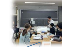
小学生と合同道徳