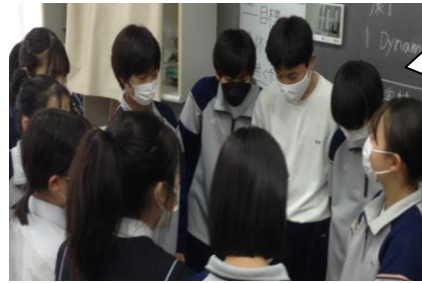
★劇 配役決め シナリオ 確認