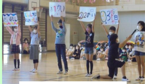
図書室は何階にある？