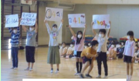
舞小は今年で何歳？