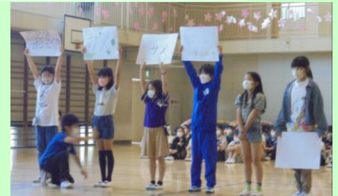
学校で飼っている生き物は？

4年生からは「ザ！舞小クイズ！！」。1年生は答えを一生懸命考えて、正解すると喜んでいました。2年生以上も正解できたかな？