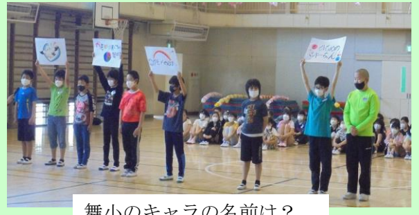
舞小のキャラの名前は？