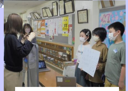
オンライン朝の会で告知しました