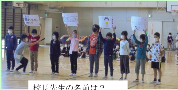
校長先生の名前は？