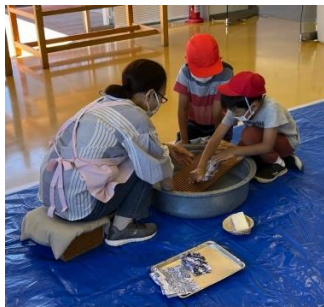
<洗濯板を使って洗濯>

社会科「わたしたちのまち浦安市」の学習の中で、道具のうつりかわりと昔の暮らしについて見て、聞いて、感じるため、郷土博物館で昔の暮らしを体験してきました。