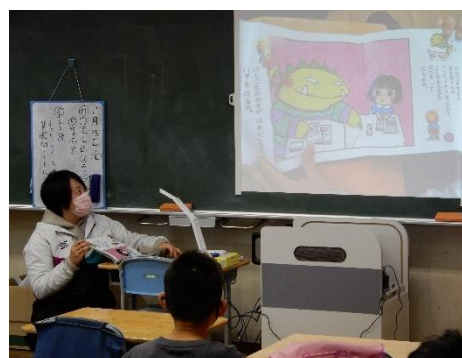
となりのせきのますだくん おしっこちょっぴりもれたろう