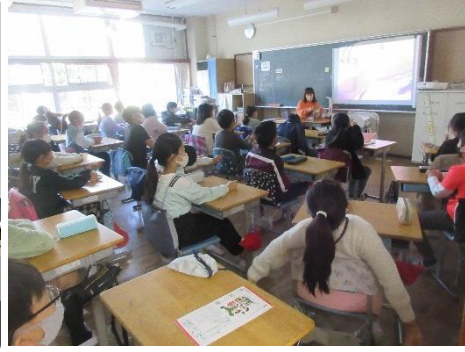
でっこりぼっこり3匹のぶたの話