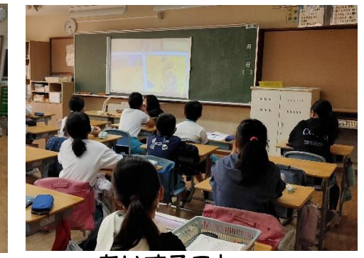
あいすること あいされること