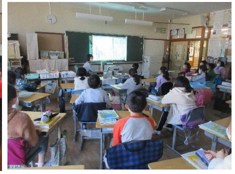
たいせつなこと ／まざっちゃおう！