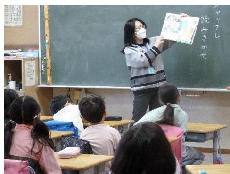
ごちゃまぜカメレオン