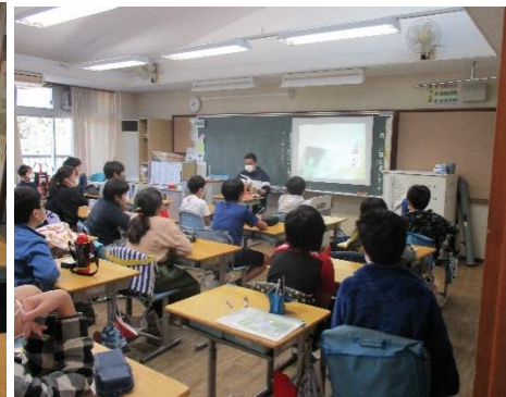
メロディ はじめてであう すうがくの絵本