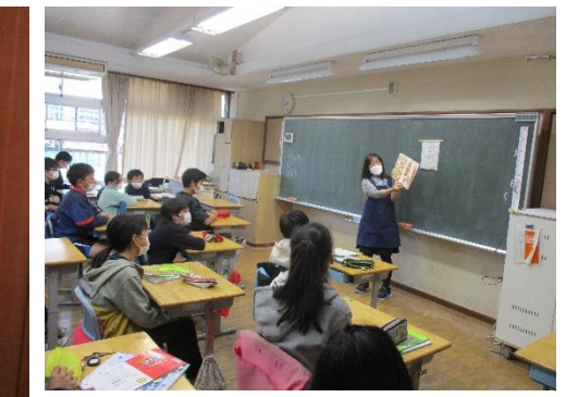
オニのサラリーマン