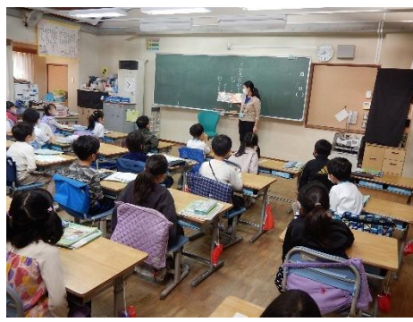
めっきら もっきら どおんどおん