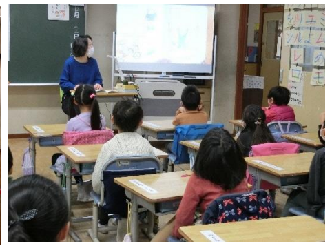
アボガドベイビー