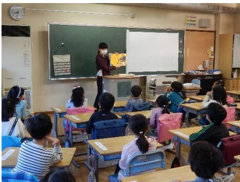
おまえ うまそうだな