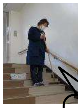
環境福祉委員会 用務員さんと一緒に週に1度、ごみの回収をしています。