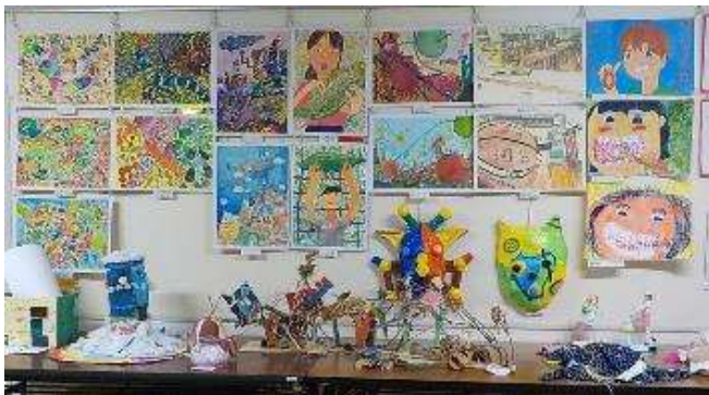
「浦安市こども作品展」出品作品 職員室前に展示しています。