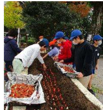
チューリップの球根植え ～栽培委員会・グリーンボランティア～