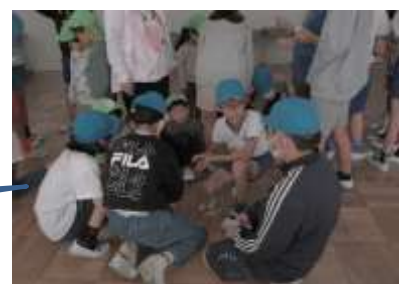
壮行会 ミニバス&サッカー部をみんなで応援をしました！

5年生は、富岡保育園の年長さんと交流をしました。 校内を案内したり、折り紙を折ったり、校庭でも一緒に遊びました。