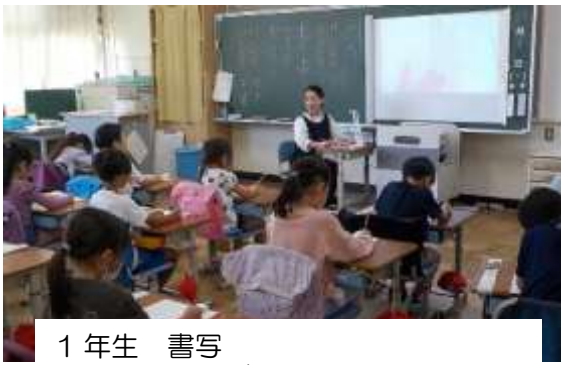
1年生 書写 お手本を見ながら上手に書けました。