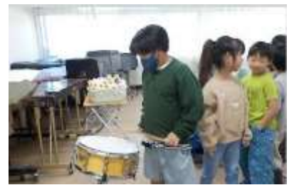
2年生 音楽 いろいろな楽器にふれました。