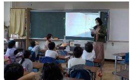
～おはなし おはなし～