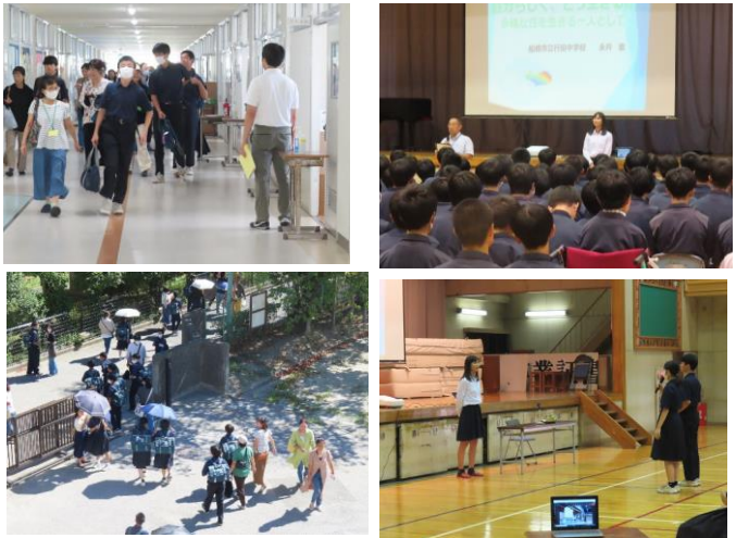
引き渡し訓練(9/1) 人権講演会(9/12)