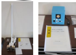
ピンポン球集め機 シュッポン