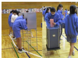
記載台と投票箱は実物を使用しました

早い人で3年後には選挙権を持つことになります。一人ひとりが一票を大切に真剣に投票しました。