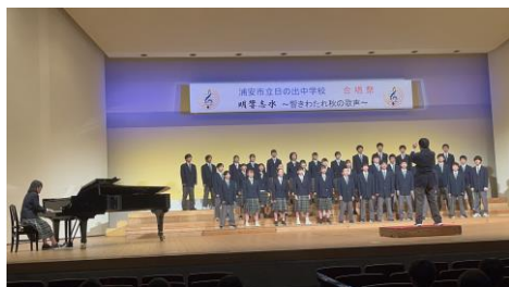
優秀賞 1年1組 時を越えて