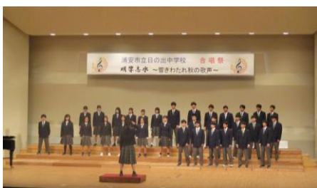
優秀賞 2年4組 この地球のどこかで