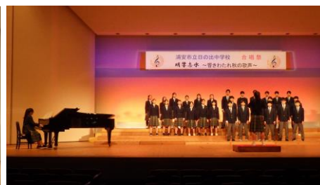
最優秀賞 3年1組 友～旅立ちの時～