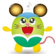
3年生 学年合唱 群青