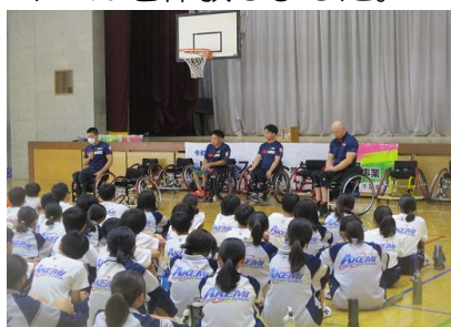
選手からお話を聞いている様子