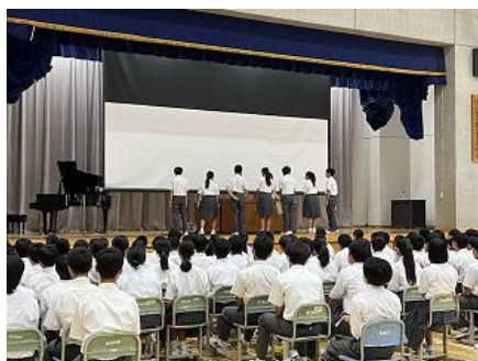
部活動などで表彰されている様子

8月26日（月）から2学期が始まりました。他市よりも1週間ほど早いスタートでしたが、皆、元気な顔で式に臨んでいました。