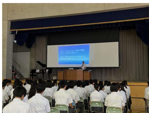
校長の話 「多様性を大切にしよう」など