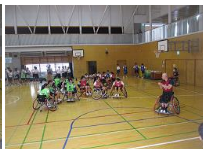
1年A組と1年B組とで車いすバスケットボールの試合をしました。 (左写真:男子 右写真:女子)