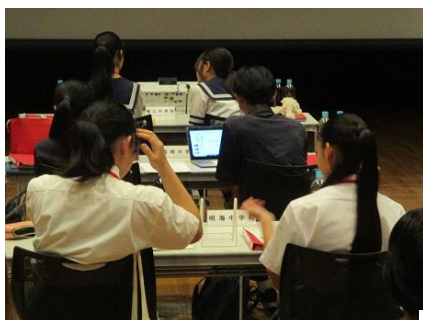
座席で出番を待ちます。