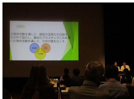
発表している様子（その2）