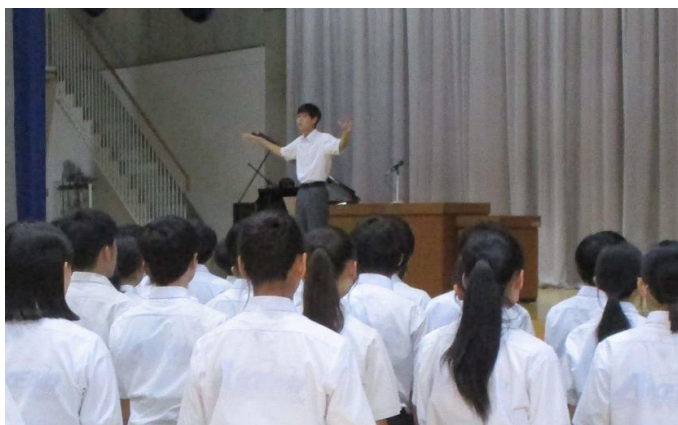
生徒自身の指揮と伴奏により、校歌斉唱が行われているようす。