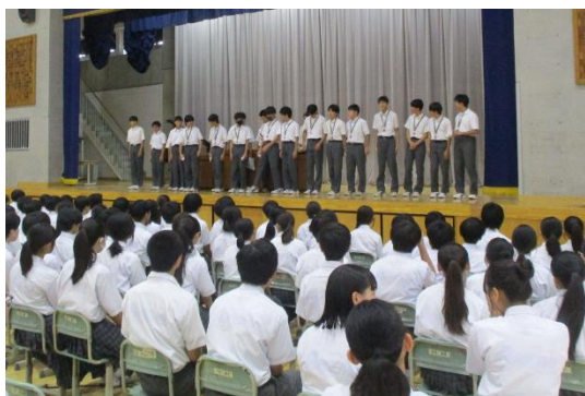
夏の総体地区大会で3位となった男子バスケットボール部。始業式前に表彰が行われました。