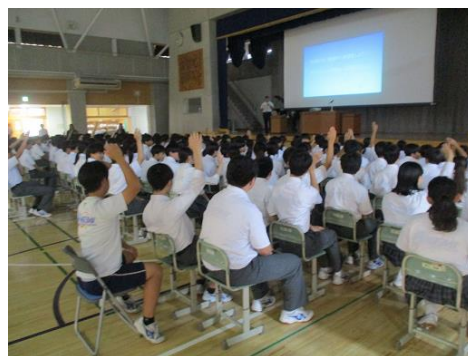
校長先生の話を聞く生徒たちのようす。