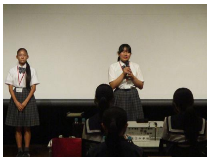
閉塾式では、それぞれ、立志塾の感想を述べました。