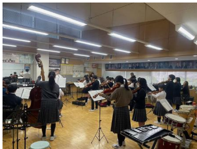
本番前の小中合わせ練習

11/14（金）、弦楽部の皆さんが、明海南小学校弦楽部とともに、ハイアット・リージェンシーのクリスマス・イルミネーション点灯式で演奏を披露してきました。