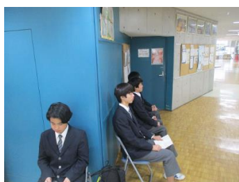
面接を待っているようす

3学年では、進路学習の一環として、日々、面接練習を行っています。学年の先生方に合格をもらった生徒は、最終的に、校長面接に臨みます。