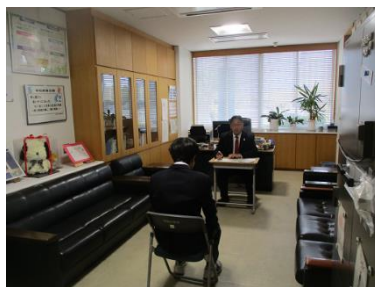
校長面接。校長室を面接仕様にして実施しています。