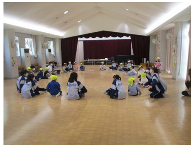
室内で園児と触れ合うグループ。輪になってゲームをしています。