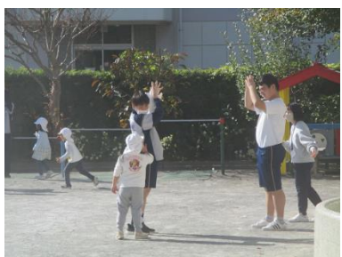
園庭で園児と触れ合うグループ。庭いっばいに元気に走り回っています。