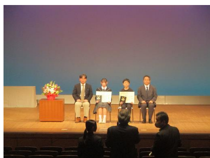
青少年健全育成連絡協議会会長と副会長との記念撮影。