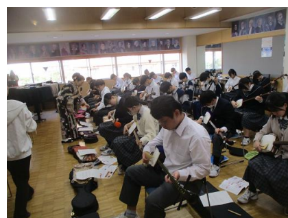
熱心に三味線演奏に取り組んでいる3年生。とても真剣な表情で弦を弾いています。