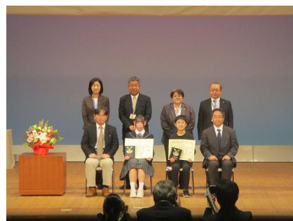
会長と副会長のほか、市長、教育長、浦安市役員の方との記念撮影。