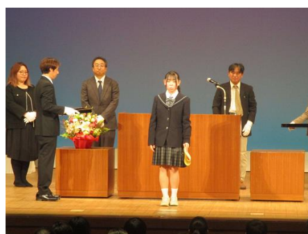
表彰式は、12／2（火）に浦安市文化会館で行われました。