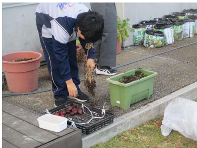
植木鉢やプランターからジャガイモを取り出しているようす

12/22（火）の放課後、1階の植木鉢とプランターで栽培していたジャガイモの収穫を行いました。小さいスペースでの栽培でしたが、20個程のジャガイモを収穫することができました。2階の畑の作物は、年明け1月に収穫予定です。