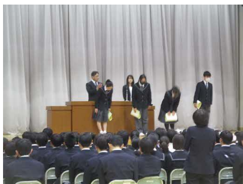
終業式前、各コンクールや作品展などの入賞者を対象に、表彰を行いました。

12月23日（火）、2学期の終業式を迎えました。121日間という長い学期でしたが、皆さんにとっては、長かったでしょうか？ それとも、短かったでしょうか？