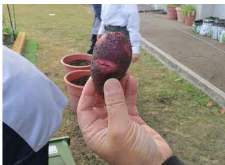
人の顔のような表面ですね。