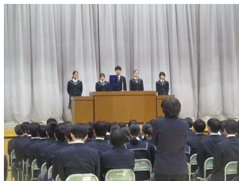
終業式では、まずはじめに、各学年代表から、2学期の振り返りがありました。