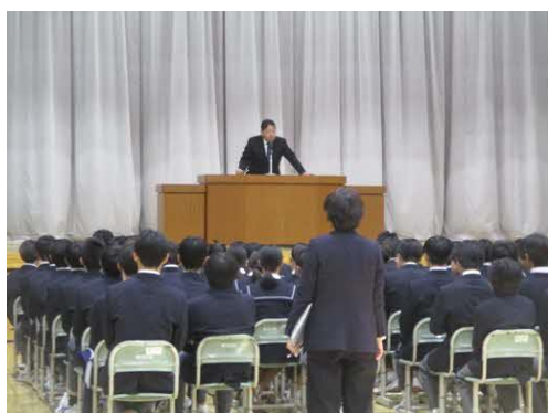
校長先生の話をしているようす