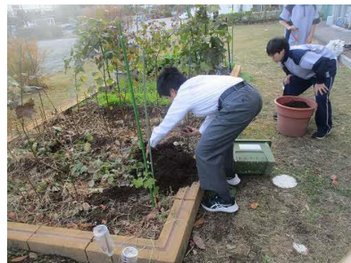
栽培後の土は、花壇に戻します。