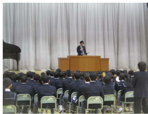
生徒指導主事の先生の話をしているようす