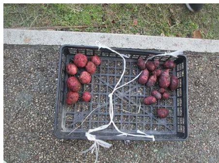
左右で品種が異なります。色がサツマイモのようなジャガイモです。