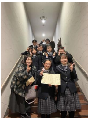
さらなる高みを目指して、頑張ってください！