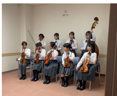
今後のコンサートやコンクールに向けて、弾みとなる金賞受賞でした。

1 / 10（土）、千葉県管弦楽コンペティションが千葉市民会館で開催され、弦楽部が見事、金賞を受賞しました。