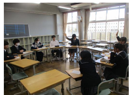
議題について審議している様子