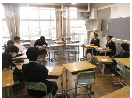
生徒会本部役員の司会により中央委員会が進行していきます。

中央委員会とは、生徒会本部役員と各専門委員会の委員長が集まり、生徒会活動について議論する会議のことで、月に 1 回、開催されています。