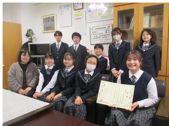
受賞報告に訪れた弦楽部のみなさん （校長室にて）