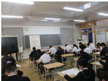
いつもの授業とは違う雰囲気です。テストに向かっていきます。