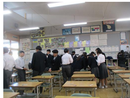
テストが終わってホッと一息。