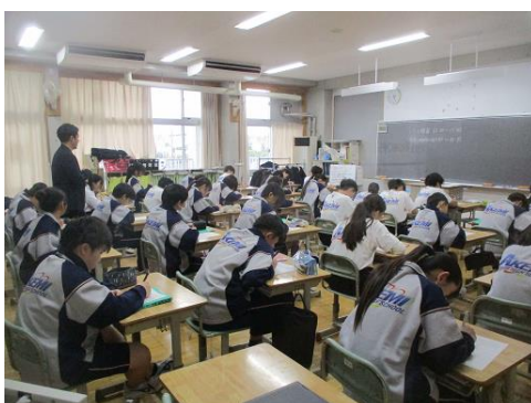
ワークシートに自分の考えを書き込んでいるようす