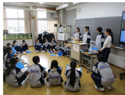
各担当・各パートごとに集まり、発表内容について検討したり練習したりしています。