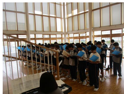
代表生徒を中心にして、合唱練習を行っています。場所は多目的ホール。