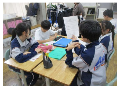
グループの中で自分の考えを共有しています。