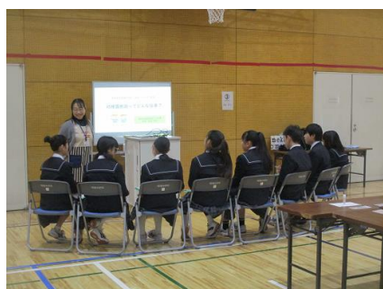
幼児教育 こども園園長のブース