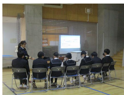
航空 パイロットのブース