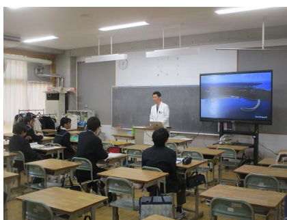
歯科医 歯科医のブース