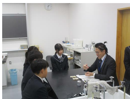
歯科関連 歯科技工士のブース