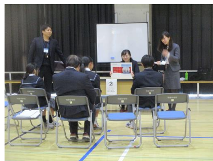
銀行 銀行員(フィナンシャル・プランナー)のブース