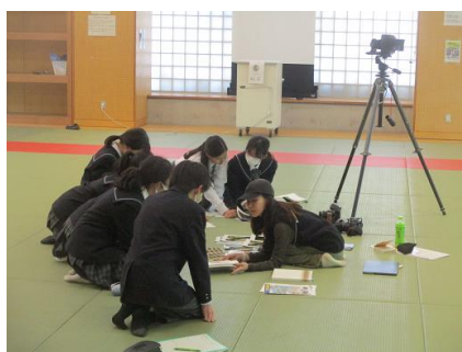
写真 フォトグラファーのブース