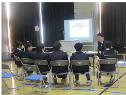
福祉 社会福祉士のブース