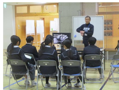
IT ソフトウェアエンジニアのブース