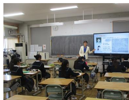
放送 アナウンサーのブース