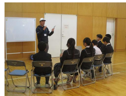
スポーツ スポーツ選手のブース