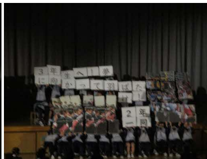
マスゲームのメッセージからは、2年生の優しさ、温かさ、人への思いやりがたくさん伝わってきました。