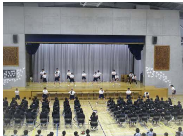
全員が、本気・全力でソーラン節を踊る姿が、大変印象的でした。