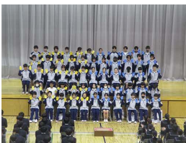
2学年恒例のハンドダンス。大変息の合った姿が印象的でした。