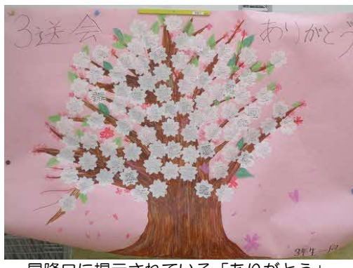
昇降口に掲示されている「ありがとう」の寄せ書き。