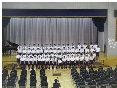
ソーラン節の後は、合唱を披露しました。