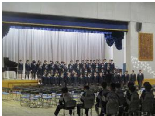
在校生への期待と感謝の気持ちを込めて合唱が送られました。